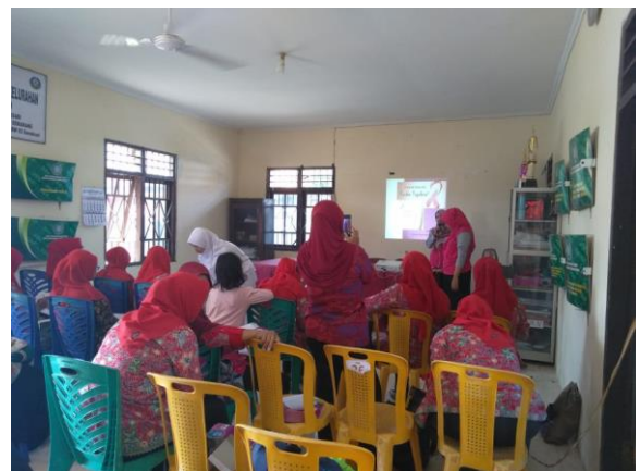
Gambar 1. Penyampaian Materi

Kegiatan pertama yang dilakukan adalah pemberian penyuluhan tentang kanker payudara meliputi prevalensi kanker payudara di Indonesia, definisi,